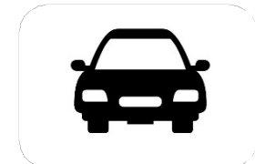
Hoàn Tiền Nhiên Liệu / Theo Quảng Đường

Nếu quý vị có bảo hiểm Washington Apple Health hoặc Medicaid, quý vị có thể đủ điều kiện nhận các dịch vụ vận chuyển của chúng tôi MIỄN PHÍ!