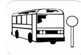
Giá Vé Vận Chuyển