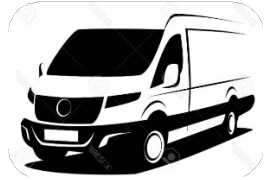
Dịch Vụ Vận Chuyển