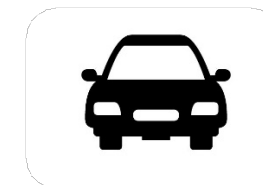
Покрытие расходов на передвижение

Члены программ Apple Health или Medicaid могут воспользоваться нашими услугами бесплатно.